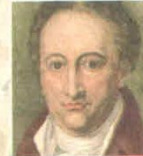
Johann Wolfgang von Goethe