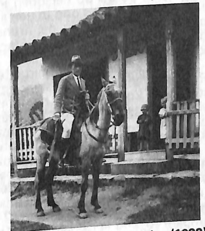
Beim Ritt durch die Filialen (1933)

Da ich auf meinen weiten Predigtreisen mit den meisten Lehrern