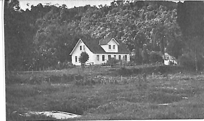
Neues Pfarrhaus von Santa Isabel, 1931 erbaut.

der deutschen Privat- und Kolonieschulen immer wieder in Kontakt kam, regte ich die Gründung eines Schulverbandes auf einer zu diesem Zweck einberufenen Lehrerversammlung in Theresópolis (heute Queçaba) an, der die persönlichen Interessen der finanziell durchweg schlecht gestellten Lehrer vertreten, wie auch die berufliche Weiterbildung fördern sollte. Die Anregung fiel auf fruchtbaren Boden. Nach kurzer Zeit hatten sich 54 evangelische und katholische Kolonieschulen zum Anschluß an den Verband gemeldet, der auch bald ein eigenes, bescheidenes Informationsblatt „Die Kolonieschule“ herausgab. Es wurden nun auch regelmäßig mehrtägige Lehrerversammlungen abgehalten, die sehr häufig auf dem „Pfarrhof“ in Santa Isabel stattfanden, da sich hier die Gelegenheit bot, 20 bis 30 Personen im geräumigen Pfarrhaus und in den alten Wirtschaftsgebäuden der früheren „Konfirmandenschule“ einfach und spartanisch unterzubringen.