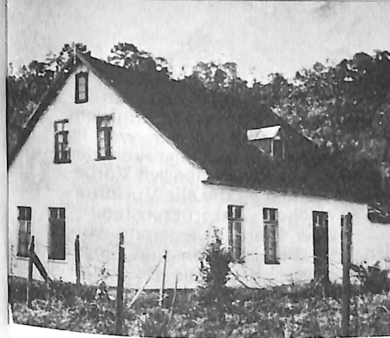
Altes Pfarrhaus von Santa Isabel, 1931 abgebrochen.

Wir Pfarrersleute empfanden es auf unserem sonst so stillen Pfarrhof, der wegen seiner Abgele-